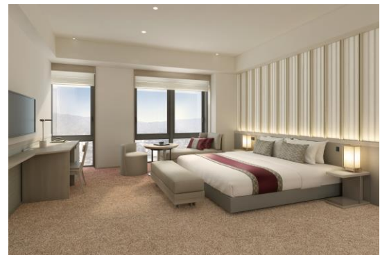
▲客室イメージ(Classy King 38㎡)