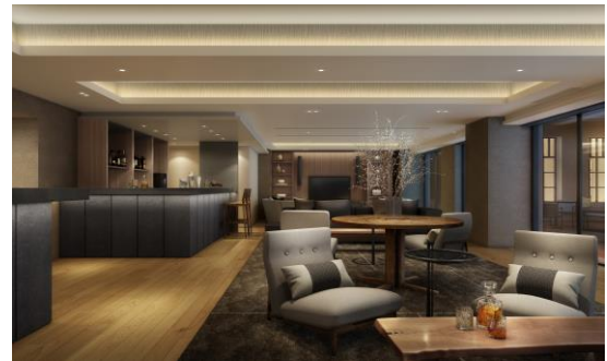
▲宿泊者専用ラウンジイメージ