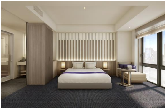
▲客室イメージ(Essential Double 23-26㎡)