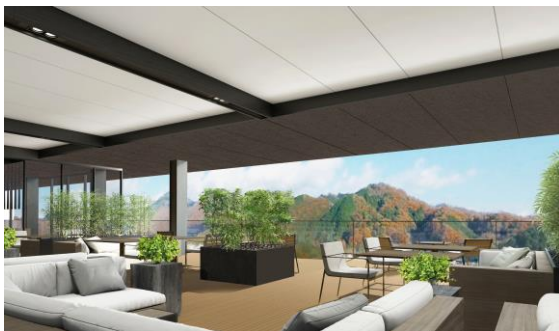
▲レストラン(テラス席)イメージ