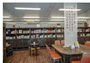
▲工事期間中の立誠図書館